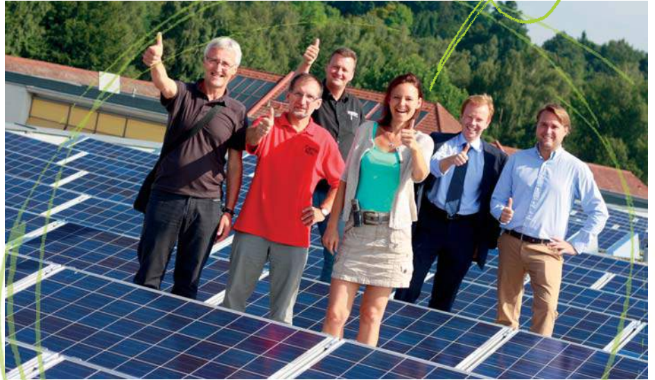
Energieeinsparung von bis zu 90%.