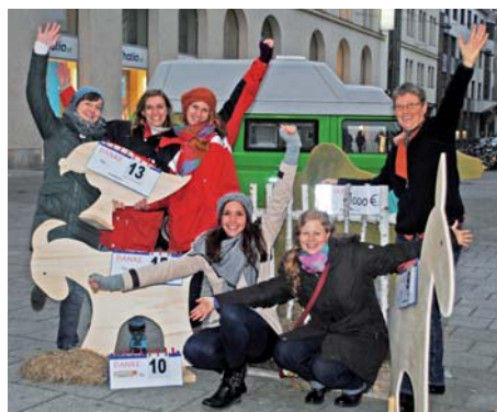
Seit 15 Jahren involviert die youngCaritas junge Menschen durch soziale Aktionen.

Seit 15 Jahren bietet die youngCaritas jungen Menschen Erfahrungsräume, um mit sozialen Themen in Kontakt zu kommen. Zum Geburtstagsfest auf der Linzer Landstraße wurde neben Musik und einer Kinder-Malecke „Coffee to Help“ ausgeschenkt. Mit den Spenden von 880,- Euro werden Tiere für Familien in Not im Ausland angekauft. Unterstützt wurde das Jubiläum von den Schulen B(R)G Enns und NMS Gmundnen Traundorf, die eigens Holztiere anfertigten, um die Spendenaktion zu veranschaulichen.