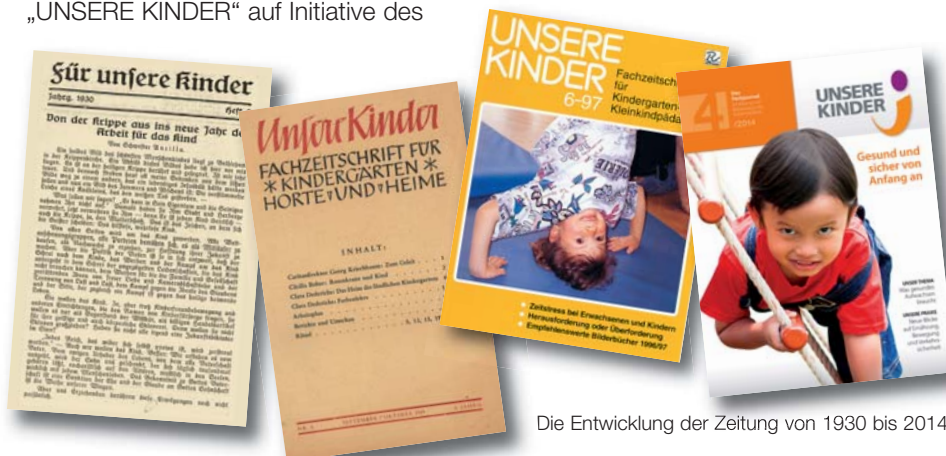
Die Entwicklung der Zeitung von 1930 bis 2014.

Unterrichtsministeriums offiziell wiederbegründet. Seither versorgt die Fachzeitschrift Bildungs- und Betreuungseinrichtungen sowie Bildungsanstalten für Kindergartenpädagogik in ganz Österreich und auch dem deutschsprachigen Ausland sechs Mal im Jahr mit alltagsnahen Artikeln aus Theorie und Praxis. 1959 übernahm die Caritas Österreich die Herausgeberschaft. Der Verlag ging an die Caritas Linz, wohin auch die Redaktion übersiedelte. Seither hat sich „UNSERE KINDER“ zu einem fachlich anerkannten, offenen und humanistisch orientierten Medium weiterentwickelt, das aktuelle Fragen und Probleme der Elementarpädagogik thematisiert. Millionen Seiten wurden gedruckt, tausende Artikel verbreitet, ganze Generationen von Kindergärtnerinnen durch diese Zeitschrift mitgeprägt. Zweimal jährlich liegt das internationale Magazin „Kinder in Europa“ bei.