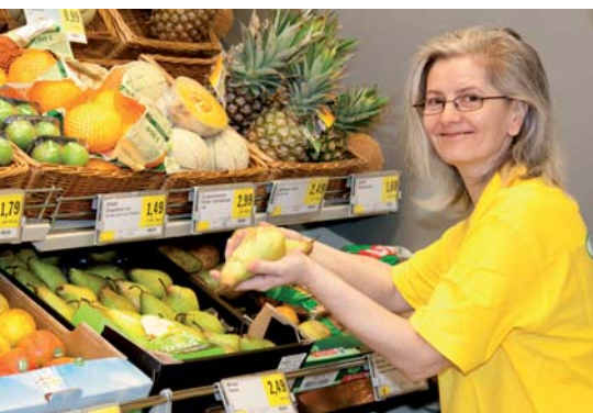
Menschen, die vom Arbeitsmarkt als „zu alt“ abgestempelt werden, finden im SPAR-Caritas-Markt in Wels eine Anstellung.

Die Sicherung der Nahversorgung im Ort und ein praxisorientiertes Ausbildungsprojekt für Menschen mit Beeinträchtigungen – das sind die Zutaten des Erfolgsrezepts der SPAR-Caritas-Ausbildungsmärkte. Mit einem weiteren Markt in Wels wurde das erprobte Konzept auf andere Zielgruppen – Wiedereinsteigerinnen mit Migrationshintergrund und ältere arbeitslose Menschen (Frauen ab 45, Männer ab 50) – ausgeweitet und ein in dieser Form einzigartiges Projekt in Österreich gestartet. Zielsetzung und „Besonderheit“ des Projekts ist die nachhaltige Integration von schwer vermittelbaren Personen in den Arbeitsmarkt.