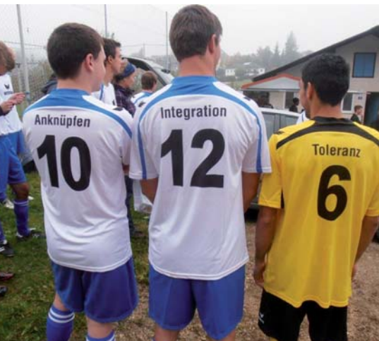
Das Miteinander stand beim Fußballspiel zwischen Menschen aus Stadl-Paura und Asylwerbern im Vordergrund.

Menschen, die nach traumatischen Fluchterfahrungen in Österreich ankommen, sind nicht nur mit ihren Erlebnissen, sondern auch mit einer völlig fremden Kultur konfrontiert. Gemeinsam zu feiern ist in dieser Situation oft die beste Brücke, die Menschen zueinander schlagen können. Darum feierte die Volkshilfe in Kooperation mit der Caritas am 13. Juni ein großes Familienfest für Menschen aus verschiedensten Ländern am Sportplatz des ATSV in Stadl-Paura.