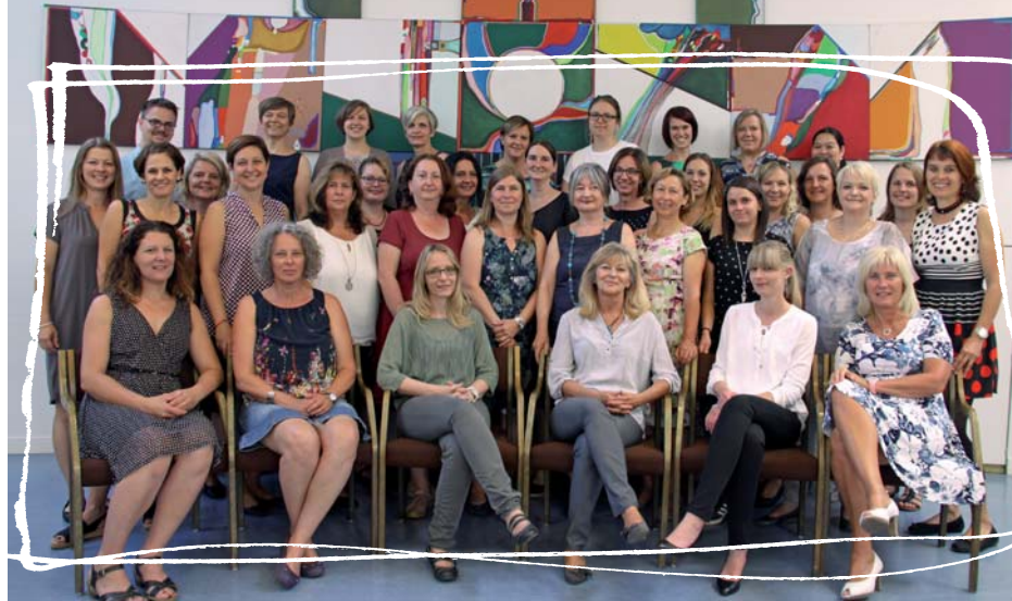
Das Team der Fachberatung für Integration im Sommer 2017.