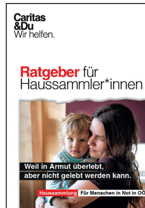
Ratgeber für Sammler*innen, A5 (21,5 x 15 cm)