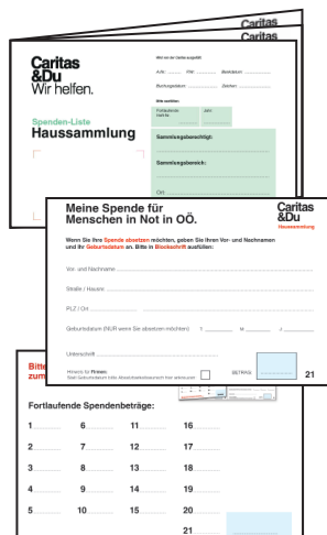
Spendenheft, A6, doppelseitig, 21 Spender*innen können einzeln eingetragen werden