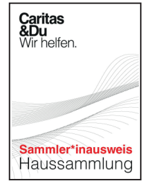
Sammelausweis, (10,5 x 7,5 cm)