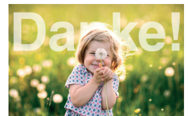
Danke-Karte für Spender*innen, A6 (10,5 x 15 cm) passt in Kuvert DIN C5/C6

Gottes Segen auf all deinen Wegen! Zuversicht und Freude sei auch mit dabei.