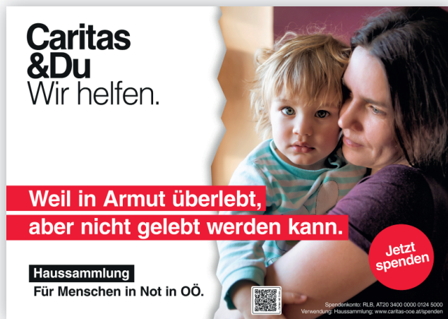
Plakat A2, quer