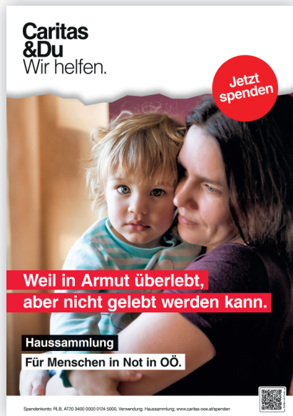
Plakat A3, hoch