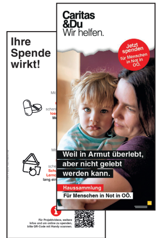
Folder für Spender*innen, DIN lang (10 x 21 cm) passt in Kuvert DIN C5/C6