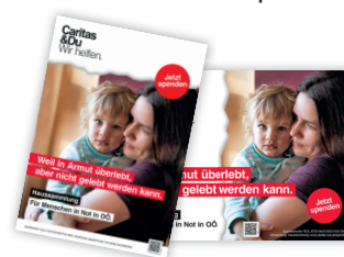
Plakate siehe Rückseite