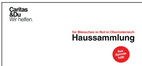
Kuvert, DIN C5/C6 (11,4 x 22,4 cm)